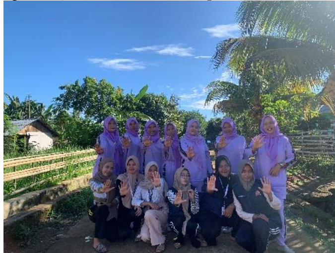
Gambar 5. Foto Bersama Pasca Acara Sosialisasi Bersama Kader Posyandu Dusun 1 Desa Pagar Jati

tinggi pada anak yang di akibatkan oleh Rotavirus yang juga bisa diakibatkan karena sanitasi yang kurang baik (Mukhlisin dan Encep, 2020).