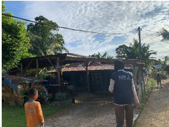
Gambar 3. Pengumpulan Data Hari Ke Dua