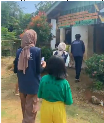
Gambar 2. Pengumpulan Data Hari Pertama

Kegiatan ini berjalan dengan lancar sehingga data yang kami dapatkan cukup memuaskan yaitu dari jumlah keseluruhan tujuh puluh tiga rumah dengan jumlah jamban sehat yang dikategorikan sebagai jamban yang kurang layak mencapai 16% (sebelas rumah) dengan enam rumah yang memiliki jamban yang kurang layak dan lima rumah yang tidak memiliki jamban. Lalu data tersebut kami olah sehingga menjadi sebuah peta tematik dengan tema "Kepemilikan Jamban Sehat".