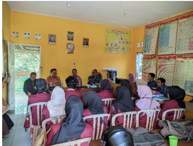
Gambar 1. Penyerahan mahasiswa dan konsultasi terkait penelitian